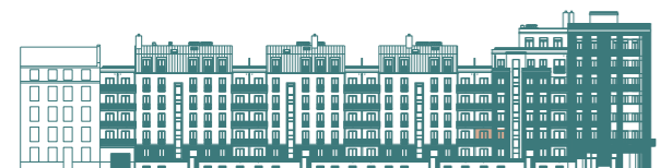
Hausfassade / Hedderichstraße

Dieser Grundrissplan ist unverbindlich und nicht maßstabsgerecht. Er dient lediglich zur Orientierung und zeigt möglicherweise aufpreispflichtige Sonderausstattungen. Möblierungen sind nicht Bestandteil der Leistungen.